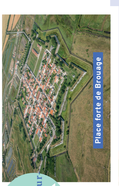
Place forte de Brouage

Contempler le chenal artésien de Brouage, perché sur un rempart du 17ème siècle