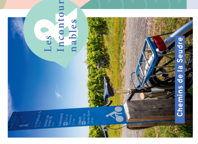
Chemins de la Seudre

Contempler le chenal artésien de Brouage, perché sur un rempart du 17ème siècle