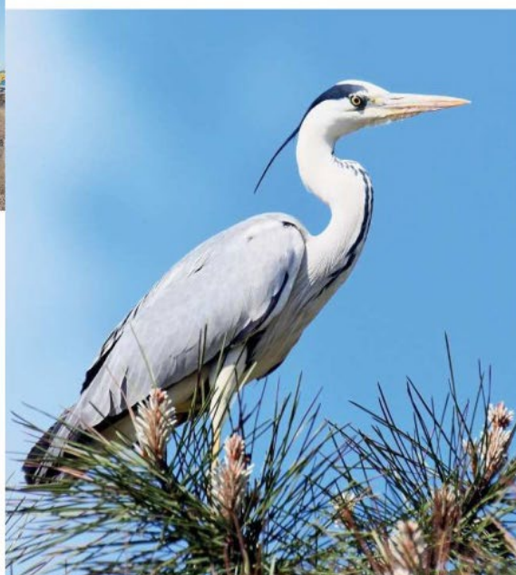
Depuis l'observatoire de Fort-Royer ou le Marais aux Oiseaux, on peut admirer de plus ou moins près un héron cendré ou un hibou moyen duc