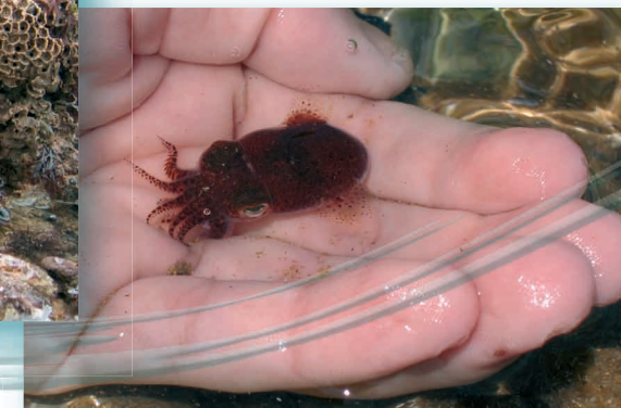
Découverte entre les rochers : une sépiole, de la famille des seiches.