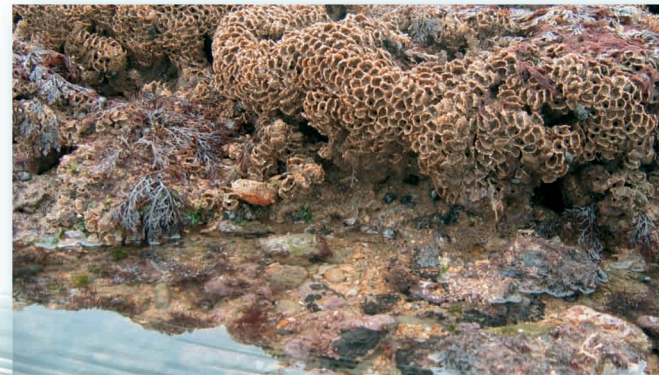
Les massifs d'hermelles sont des constructions animales (vers) aussi belles que fragiles.